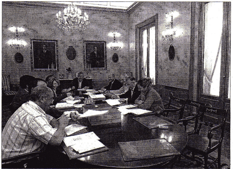
La junta de gobierno de la Diputación también aprobó la resolución de varias convocatorias de ayudas a municipios./PATRICIA